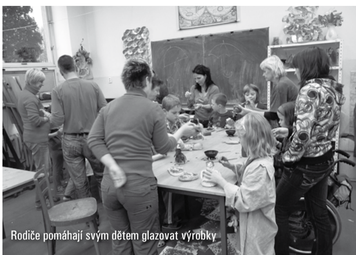
Rodiče pomáhají svým dětem glazovat výrobky