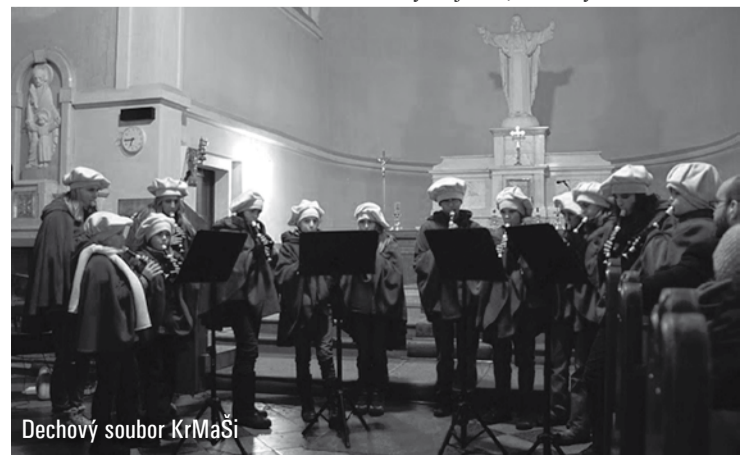
Dechový soubor KrMaŠi