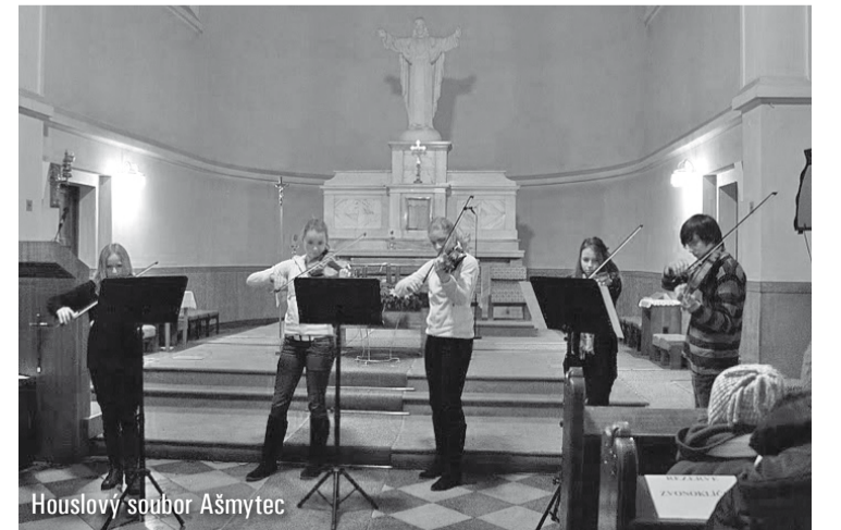
Houslový soubor Ašmytec